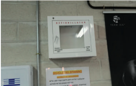
Estado general del polígono industrial de Paracuellos (arriba a la izquierda), en el gimnasio municipal el cajetín destinado a contener el desfibrilador está vacío (abajo a la izquierda) y el estado de parques y jardines (derecha).

porcentaje de casi el 90% . En las 10 restantes, el voto en contra de Cs no ha significado siquiera que no salieran adelante . Es decir, el Equipo de Gobierno ha sacado adelante todas y cada una de sus propuestas en Pleno, de modo que ha podido trabajar con absoluta libertad en todas las áreas de actuación. Propuestas de toda índole y que afectan a diferentes temas del municipio, desde el