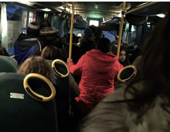
Los autobuses que bajan por la mañana a Madrid se encuentran saturados debido a la supresión de una de las líneas que nos conectaban con Barajas, provocando serios problemas a los vecinos.